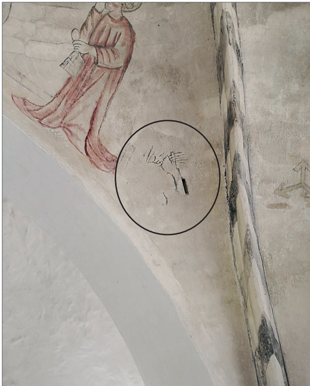
Guds hånd der redder en synder fra Helvedets ild.

Hvælvingernes ribber har sorte skrå tværsnit der er samlet i en rød og grøn roset. Der er ikke yderligere udsmykning i koret bortset fra det nævnte bomærke.