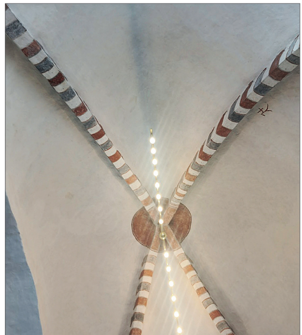
Buede tværbånd i kirkens vestligste forlængelse.

Ribberne i hvælvet i kirkens vestlige forlængelse har skiftende grå og røde buede tværbånd.