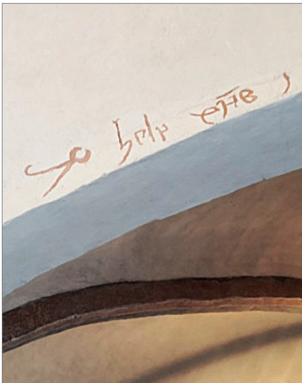
I buen kan ses en knibtang.

Meget tyder på at der på Fyn har været 4-5 kalkmalere, heriblandt Træskomaleren, der i forskellige konstellationer efter behov har samarbejdet med hinanden i de enkelte kirker. Kalkmalerne havde forskellige bomærker. Det bomærke Træskomaleren beviseligt har efterladt i Ørbæk Kirke, findes også