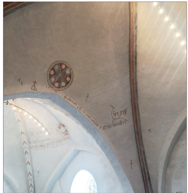
Ribberne i skibets midterste del.

Ribbeudsmykningen i skibets østside og i tårnhvælv består af snit på underkanten. I skibets midterste hvælv er ribberne delt på langs af røde eller sorte streger.