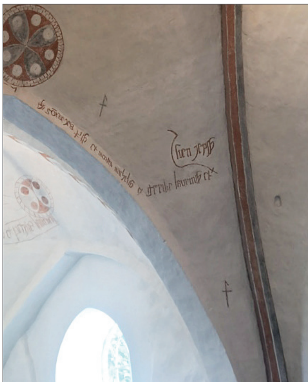
Kirkens anden inskription.

relsen blev kirken udvidet mod vest. Kirken har oprindeligt haft flade trælofter. Disse måtte vige for hvælvinger da gotisk byggestil blev moderne omkring 1250, først i koret, siden i senmiddelalderen i skibet (to fag i den oprindelige del, et fag i den tilbyggede del) hvor også tårnet kom til.